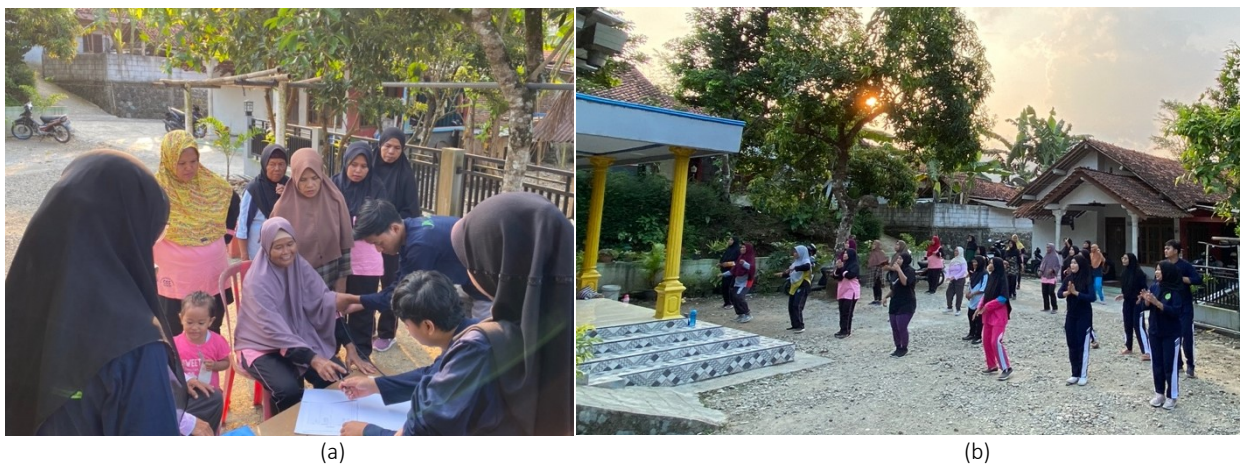
Gambar 2. (a) Pengukuran tekanan darah; (b) Pelaksanaan olahraga sehat

Program senam berjalan lancar, dengan partisipasi aktif dari seluruh peserta lansia yang berjumlah 37 orang. Seluruh peserta menunjukkan antusiasme yang tinggi dalam mengikuti latihan rutin selama empat minggu berturut-turut. Keterlibatan penuh peserta merupakan indikator positif bahwa program ini diterima dengan baik oleh masyarakat lansia. Kegiatan ini berlangsung pada musim kemarau, yang menguntungkan karena tidak ada gangguan dari hujan. Hal ini memudahkan pelaksanaan program di luar ruangan tanpa perlu mencari lokasi alternatif. Setiap sesi latihan fisik dilaksanakan pada pukul 08.00, waktu yang ideal karena sinar matahari pagi memberikan banyak manfaat bagi kesehatan, termasuk membantu produksi vitamin D dan memperkuat sistem kekebalan tubuh (Siervo et al., 2015). Sesi latihan fisik yang rutin tidak hanya memberikan manfaat fisik tetapi juga meningkatkan semangat sosial peserta. Para lansia merasa lebih termotivasi untuk menjaga kesehatan mereka, dan program ini menjadi wadah yang positif untuk berinteraksi sosial. Hasilnya, program ini berhasil memberikan dampak yang signifikan terhadap peningkatan aktivitas fisik dan kesehatan lansia di wilayah tersebut.