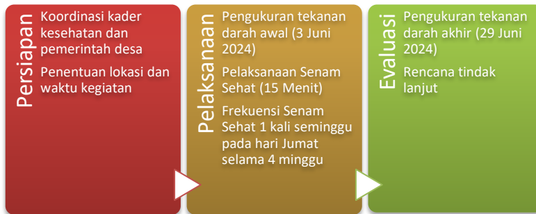
Gambar 1. Alur Kegiatan

gerakan inti, dan pendinginan. Program senam ini dirancang agar mudah diikuti oleh lansia dan aman dilakukan dengan bimbingan instruktur yang berpengalaman. Program latihan fisik sehat ini dilaksanakan seminggu sekali, setiap hari Jumat, selama empat minggu berturut-turut. Setiap sesi latihan fisik dirancang untuk merangsang sirkulasi darah, memperkuat jantung, dan membantu menurunkan tekanan darah peserta. Selama tahap evaluasi, setelah empat sesi program latihan fisik sehat, dilakukan post-test dengan mengukur tekanan darah peserta untuk menilai dampak program. Data yang terkumpul dianalisis secara deskriptif, dengan membandingkan tekanan darah peserta sebelum dan sesudah program untuk mengevaluasi perubahan yang diamati setiap minggu.